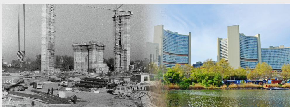
Строительство Венского международного центра началось в 1973 году, завершилось в 1978 году, а его официальное открытие состоялось 23 августа 1979 года. В нем располагаются несколько венских организаций системы Организации Объединенных Наций и Центральные учреждения МАГАТЭ.