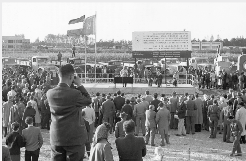
Церемония открытия лабораторий МАГАТЭ в Зайберсдорфе, Австрия, 1959 год. Лаборатории МАГАТЭ обеспечивают деятельность Агентства в области ядерной проверки, продовольствия и сельского хозяйства, здоровья человека, промышленных применений и окружающей среды.