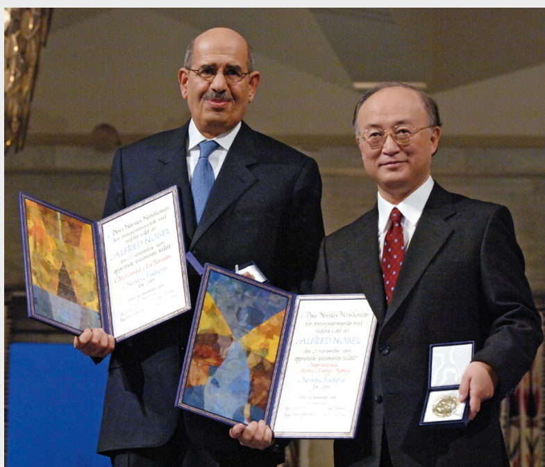
Генеральный директор Мохамед ЭльБарадей и Председатель Совета управляющих в 2005–2006 годах посол Юкия Аmano на церемонии вручения Нобелевской премии мира в ратуше г. Осло, 10 декабря 2005 года.