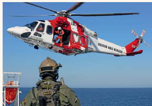
Вертолет, участвующий в операции по восстановлению контроля над судном во время полевых учений.

В дело вступили компетентные органы. На основе заранее подготовленных планов, тесной координации и тщательной подготовки персонала работники Шведского управления по радиационной безопасности, национальной полиции, береговой охраны и Шведской компании по обращению с ядерным топливом и отходами совместными усилиями восстановили контроль над судном. Их планы были тщательно проработаны на основе национальных регулирующих положений и учебных мероприятий, а также руководств МАГАТЭ по обеспечению физической безопасности перевозки и подготовительных учений. При выработке стратегии физической безопасности на транспорте были учтены также результаты теоретических учений, которые были проведены в феврале 2015 года в рамках подготовки к нынешним учениям и в которых были