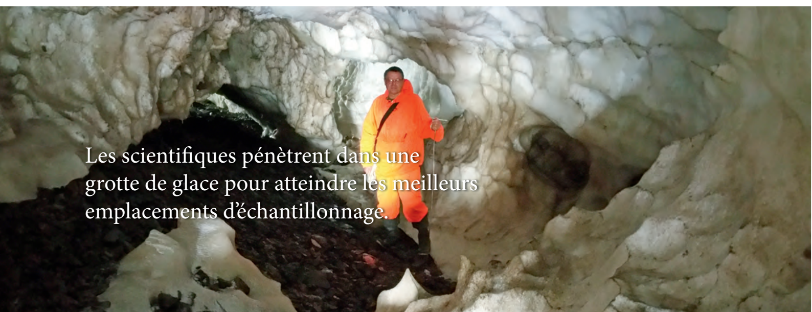
Les scientifiques pénètrent dans une grotte de glace pour atteindre les meilleurs emplacements d'échantillonnage.