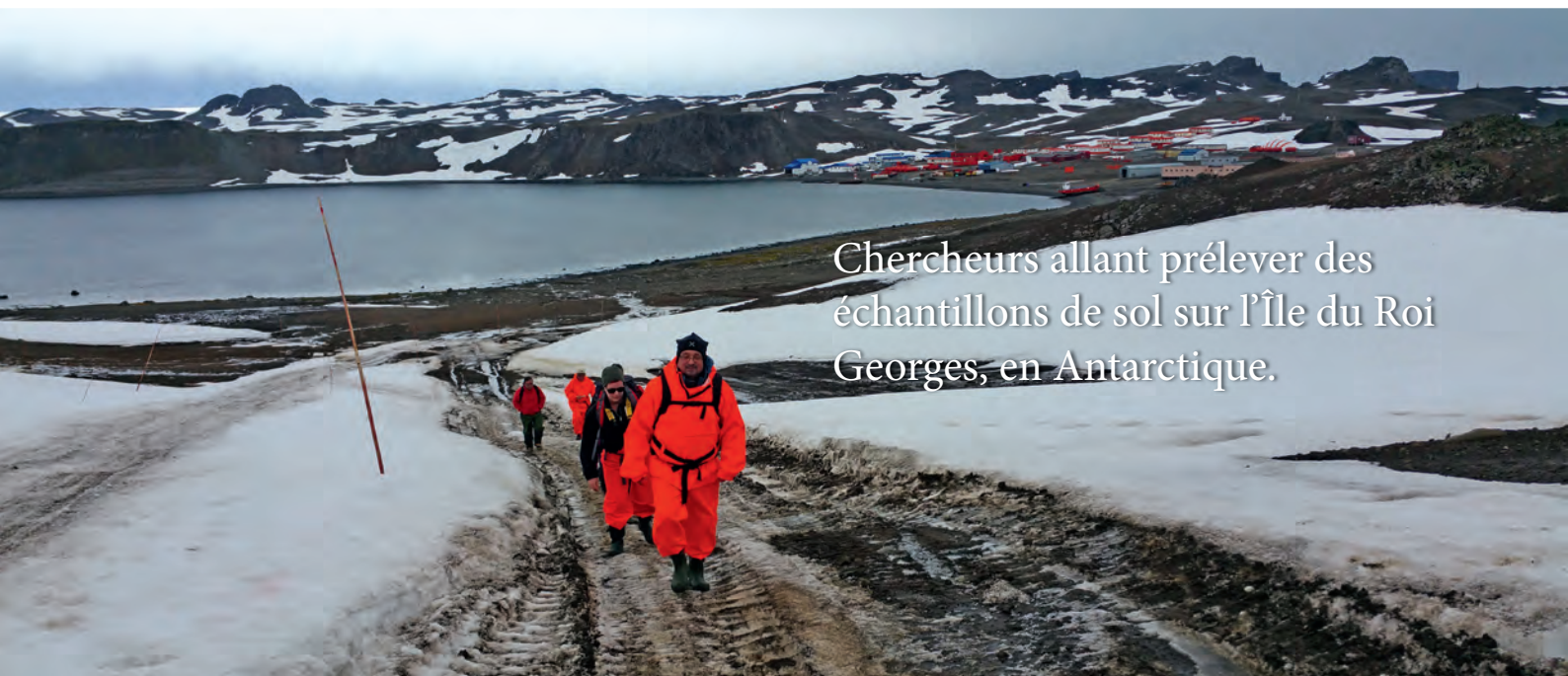
Chercheurs allant prélever des échantillons de sol sur l'Île du Roi Georges, en Antarctique.

La collecte des échantillons et l'analyse des données seront effectuées de juillet 2015 à juillet 2016. « Si cette phase du projet se passe bien, lors d'une phase suivante