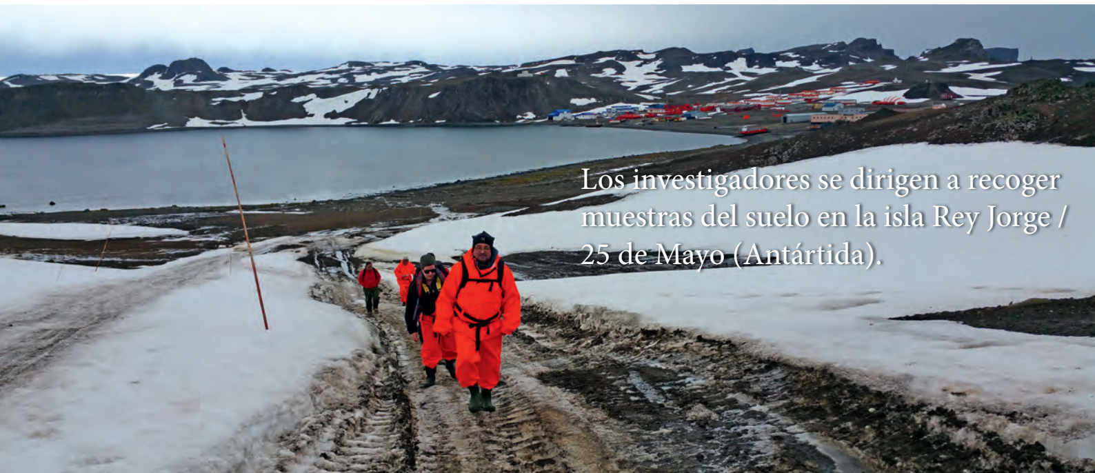
Los investigadores se dirigen a recoger muestras del suelo en la isla Rey Jorge / 25 de Mayo (Antártida).

La recolección de muestras y el análisis de los datos se efectuarán entre julio de 2015 y julio de 2016. “Si esta fase del proyecto va bien, iniciaremos otra en la que examinaremos cómo podemos adaptarnos al cambio climático. Porque una cosa es evaluar el impacto, pero la cuestión más importante es cómo podemos usar esta información para ayudar a las