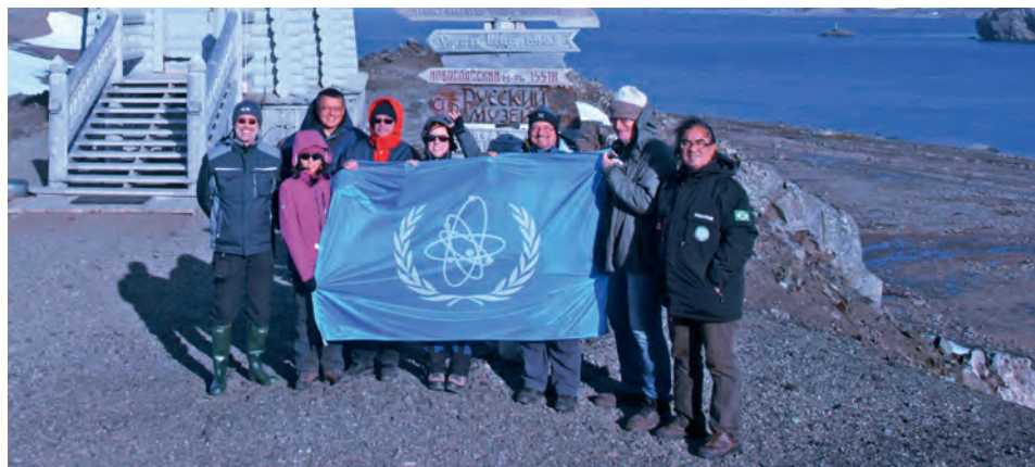
Miembros del equipo de investigación científica que visitaron la isla Rey Jorge / 25 de Mayo (Antártida).