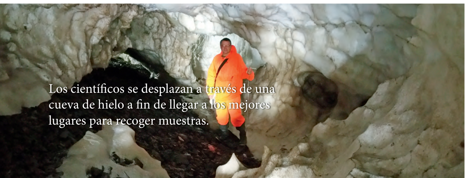
Los científicos se desplazan a través de una cueva de hielo a fin de llegar a los mejores lugares para recoger muestras.