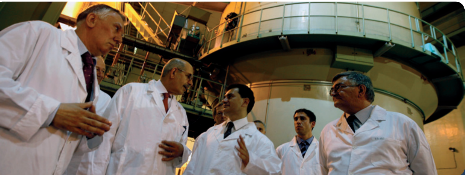
De haut en bas : M. ElBaradei en compagnie de membres du personnel de l'Institut chinois de l'énergie atomique (Chine, décembre 2006. Photo : AIEA) ; plantant un jeune arbre à l'Institut kenyan de recherche agricole (Muguga, Kenya, 24 juillet 2009. Photo : K. Aning/AIEA) ; visitant les laboratoires des services de surveillance et de protection radiologiques de l'AIEA (Vienne, Autriche, 21 novembre 2008. Photo : D. Calma/AIEA) ; contrôlant l'état d'avancement du plus grand projet de coopération technique jamais exécuté par l'AIEA à Vinca (Serbie) (2 juillet 2009. Photo : AIEA).