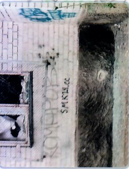
4.11.2023 г. один удар БПЛА по зданию жилого дома по адресу: ул. Набережная, д. 24