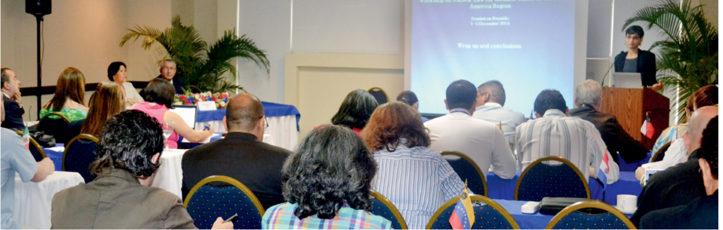
与会者参加2014年12月在多米尼加共和国圣多明各为拉丁美洲地区成员国举办的核法律地区讲习班。