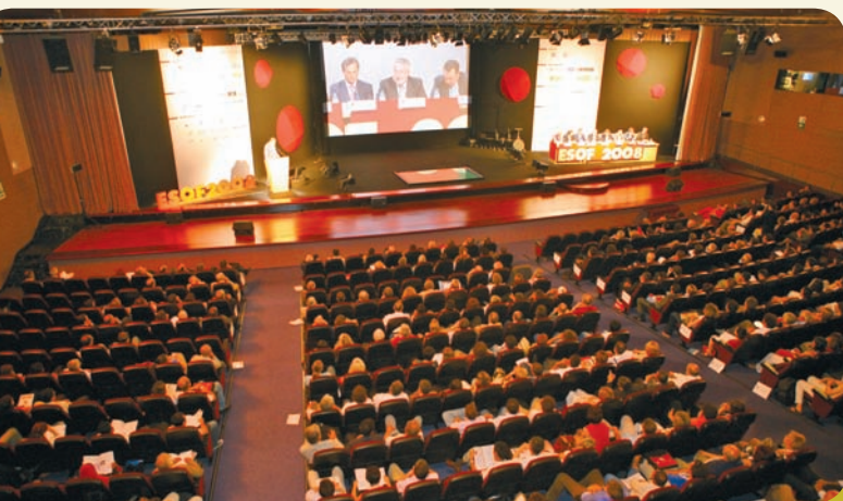
Foto: ESOF 2008 congregó a unos 4 000 participantes