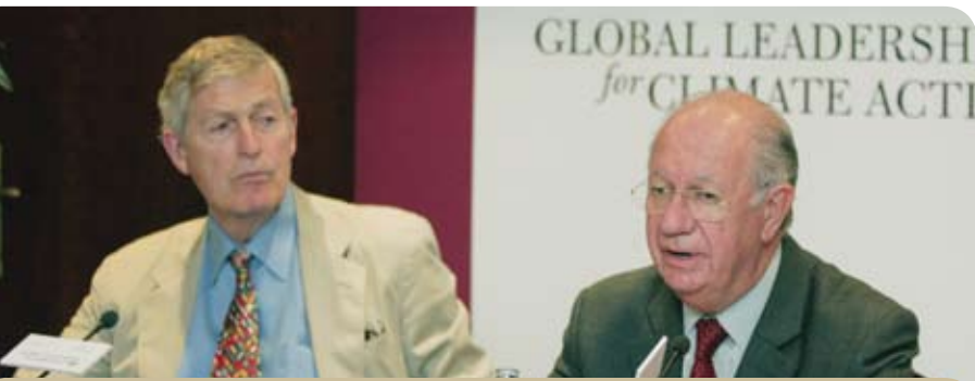
前美国参议员、联合国基金会主席Tim Wirth（左）和马德里俱乐部主席Ricardo Lagos（右）。

鉴于所需响应的范围，全球气候行动领导建议在《联合国气候变化框架公约》的支持下达成一项全面的、长期的、2012年后协定。这将向市场发出一个明确的信号，并为各国实施最符合本国国情的减排战略提供灵活性。除了为全面的2012年后协定的谈判制定时间表，各缔约方还应同意通过四个谈判途径解决缓解、适应、技