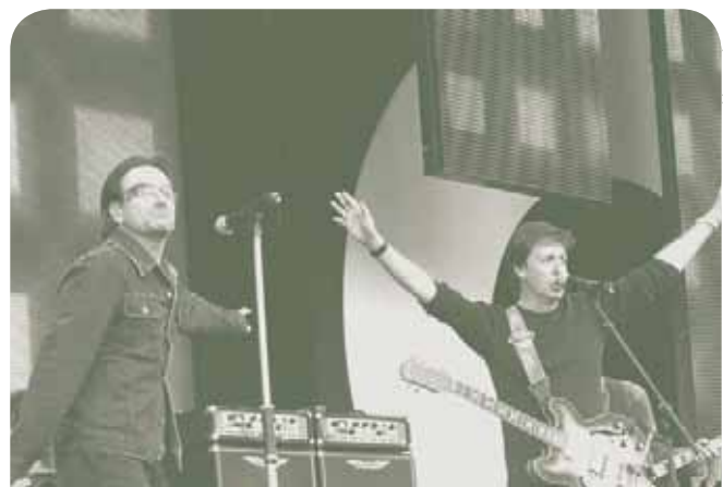
Bono de U2 y Sir Paul McCartney en el concierto Live 8 celebrado el 2 de julio de 2005 en Hyde Park, Londres.

Antes hice mención de los 6 500 africanos que mueren a diario de enfermedades evitables y curables, como el SIDA: He visto cómo la gente hacía cola para morirse, tres en una cama, en Malawi. Ésa es la crisis de África. Pero el hecho de que en Europa o en los Estados Unidos no tratemos esta situación como una emergencia y el hecho de que no se hable de ello todos los días en las noticias, ésa es nuestra crisis.