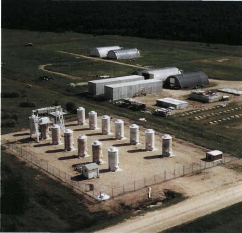
Vista aérea de una instalación de almacenamiento de combustible gastado en recipientes de hormigón en el Canadá.

Es probable que algunas esferas reclamen mayor atención, entre ellas los asuntos relacionados con el almacenamiento en condiciones de seguridad de combustible de alto grado de quemado; el almacenamiento de combustible dañado o deficiente; los efectos económicos del almacenamiento a largo plazo; el uso de tecnologías de almacenamiento nuevas y diferentes y la mejor explotación de las tecnologías existentes. En esas y otras esferas, el OIEA continúa dispuesto a ayudar a los países a afrontar los problemas y solucionarlos.