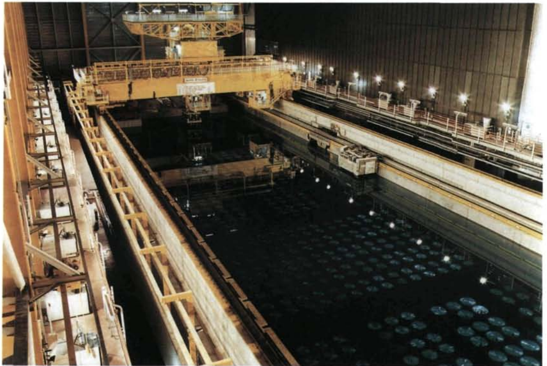
Piscina de almacenamiento de combustible gastado de la Planta Térmica de Reelaboración de Oxido de Sellafield, en el Reino Unido.