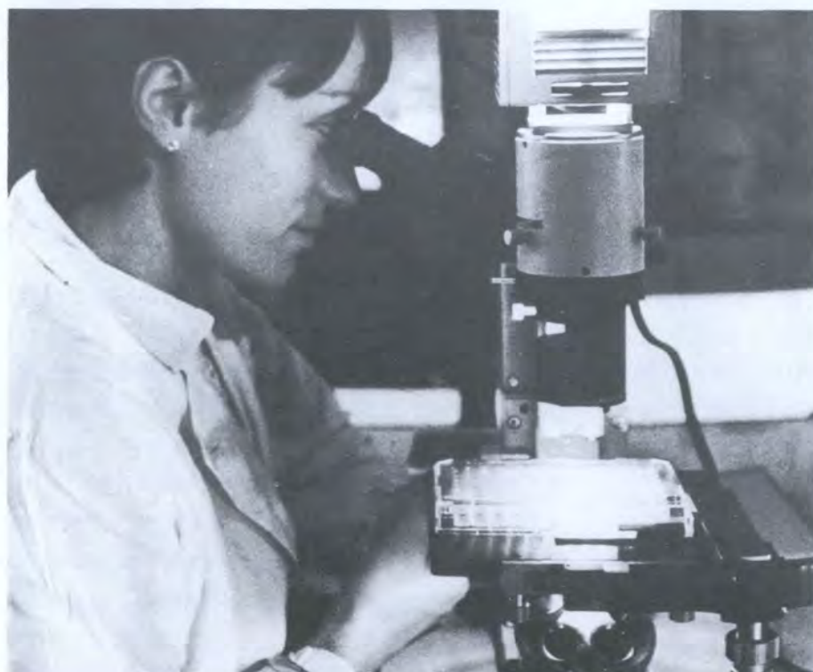
科学家正在观察单克隆抗体生产过程中的细胞培养情况。

大多数 SSDL 业已建成，可提供校准服务，并推动了放射治疗和辐射防护剂量学的质量保证工作。随着放射治疗应用范围的扩大，准确测量辐射剂量的要求必将提高。虽然无论是辐射防护还是环境辐射监测中所遇到的那种极低水平的剂量测量，对准确度的要求都不高，但切尔诺贝利事故后的经验已经表明，测量低剂量的剂量仪需要更好地校准，其可靠性也需进一步提高。为此已开始实施一项 SSDL 的质量保证计划。用现有的设施，就能确保对不同时间、不同场所