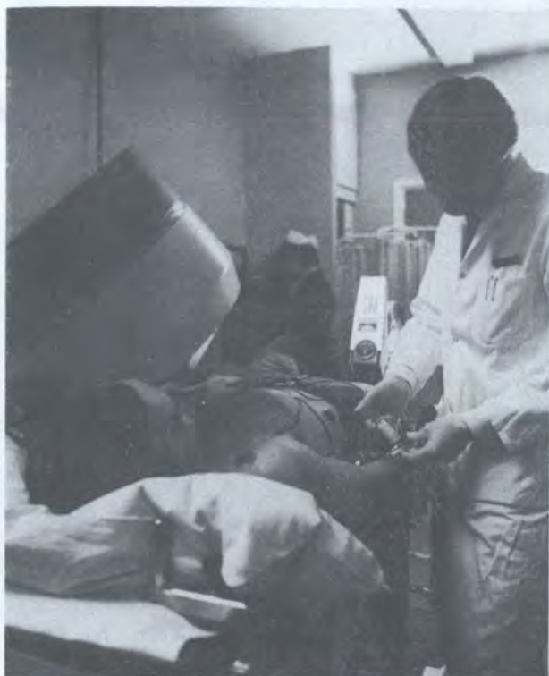
图为正在向患者注射一种短半衰期的放射性同位素，以得到有关心率和肺功能的可视信息。

* 关于 IAEA 在核医学及相关领域计划的更全面的报道，参见 IAEA Bulletin Vol.28, No.2 (1986) 和 Vol.25, No.2 (1983)。