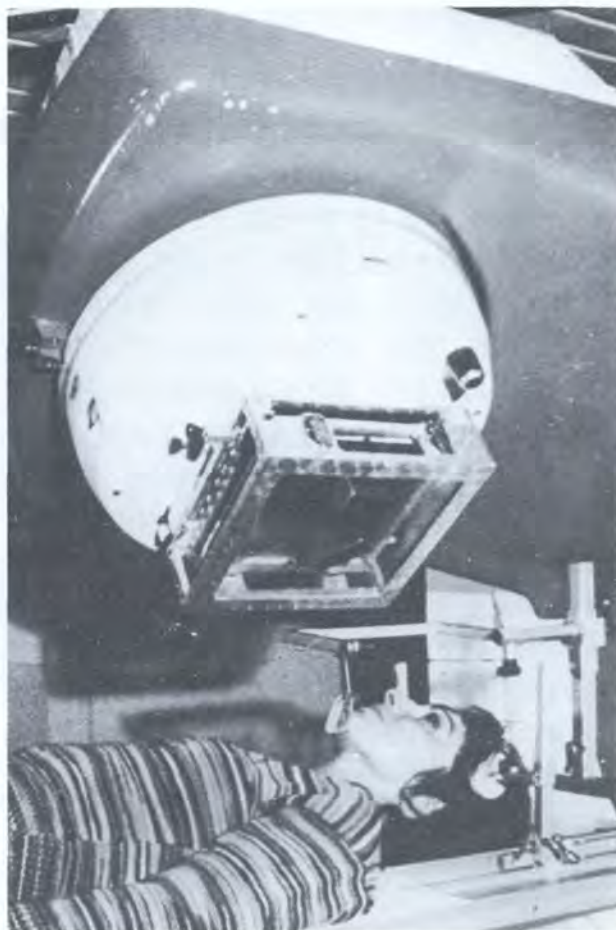
外照射束流放射治疗设备。

人患有不同程度的缺碘症。但是，大多数痕量元素是以更为复杂且不易察觉的方式产生它们的影响的，仅在最近才有证据表明，痕量元素缺乏症可能比以前认识到的普遍得多。许多国家已在某些经选择的食物中添加碘和铁之类的元素，他们还积极支持添加铜、锌、硒和其它元素的研究工作。