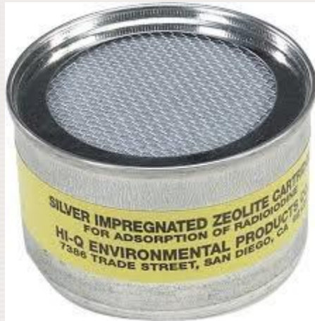
Cartucho de zeolita de plata