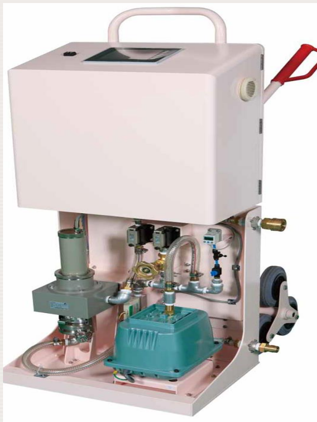
Detector NaI, límite inferior de detección: 3,7 \text{ Bq/m}^3 .