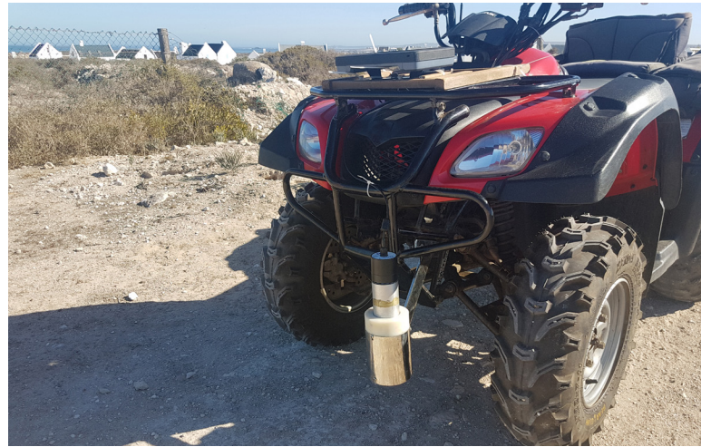
Système de détection par spectrométrie gamma portable GISPI (Gamma in Situ Portable Device) installé à l'avant d'un véhicule et servant à mesurer la radioactivité naturelle des sédiments des zones côtières.