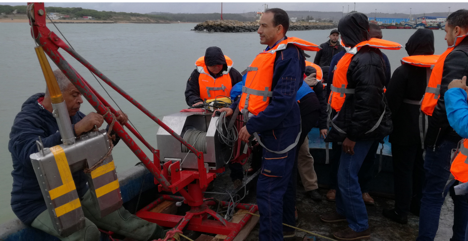
Experts de l'AIEA lors d'une formation à l'utilisation d'une jauge nucléonique pour mesurer les concentrations de sédiments dans le chenal d'accès au port de Larache (Maroc).

laboratoires de Seibersdorf (Autriche) et des stagiaires ont également bénéficié de programmes d'étude des sédiments au moyen d'applications des radiotraceurs de parrainage dans des laboratoires désignés d'États Membres. L'AIEA joue un rôle de premier plan dans le transfert de la technologie des radiotraceurs. Elle aide les pays à mettre en valeur leurs ressources humaines, soutient la formation de jeunes spécialistes et contribue au maintien de bonnes pratiques nécessaires à la durabilité des technologies et au transfert des connaissances. L'élaboration de supports de formation à l'intention des spécialistes et praticiens des radiotraceurs est l'un des principaux objectifs de cette assistance essentielle à l'amélioration de la protection des côtes et des cours d'eau.