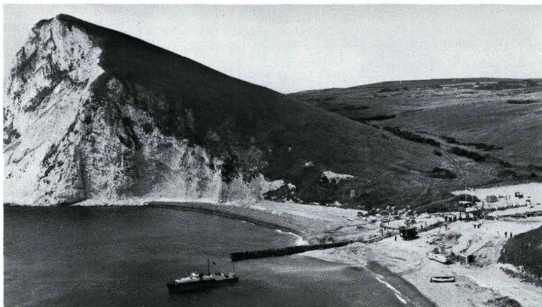
Canalisation en construction pour l'évacuation des effluents de l'établissement de l'UKAEA à Winfrith Heath (Angleterre).

évacués ne sont que faiblement radioactifs, ces méthodes montrent que les doses de radioexposition de l'homme seront parfaitement insignifiantes. La deuxième méthode a toutefois été appliquée même à ces cas et des rejets ont été interdits parce qu'ils auraient pu être évités ou réduits sans trop de difficultés. En déterminant ce qui est raisonnablement possible dans les circonstances données, les inspecteurs du gouvernement tiennent compte des possibilités économiques et techniques de réduire les quantités à rejeter, ainsi que du niveau prévu de la dose et de l'importance des réductions possibles par rapport aux doses limites recommandées par la CIPR.