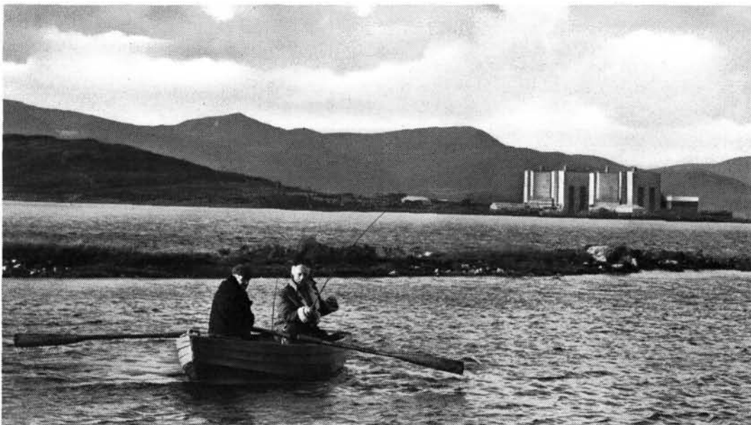
Essai de pêche à la mouche dans le lac près de la centrale nucléaire de Trawsfynydd (Pays de Galles).

donné d'opérations, et ces niveaux de doses ont alors été considérés comme des normes d'irradiation. Les deux acceptions du terme «norme» peuvent souvent ressortir du contexte, la possibilité de confusion reste évidente.