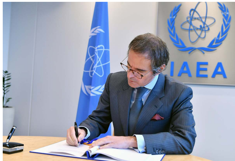
El Director General del OIEA, Sr. Rafael Mariano Grossi, firma el Acuerdo de Salvaguardias y el Protocolo Adicional con Eritrea el 20 de abril de 2021.

nucleares y otros materiales puestos a disposición por el Organismo o a petición de este, o que estén bajo su dirección o control, no sean utilizados de modo que contribuyan a fines militares. Esto puede afectar, por ejemplo, a un proyecto del OIEA que, en virtud del Estatuto del OIEA, requiera la aplicación de las salvaguardias.