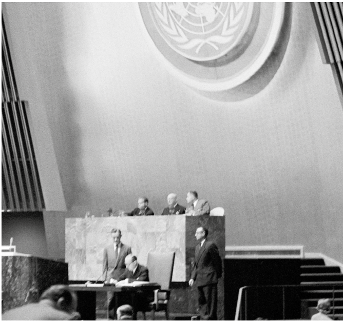
Ceremonia de clausura de la Conferencia sobre el Estatuto del OIEA, 26 de octubre de 1956. El Estatuto del OIEA entró en vigor el 29 de julio de 1957.

los VOA se aplican al material nuclear presente en las instalaciones, o partes de ellas, que los EPAN proponen para la aplicación de las salvaguardias del OIEA. El OIEA selecciona de la lista de posibles instalaciones aquellas en las que desea aplicar salvaguardias.