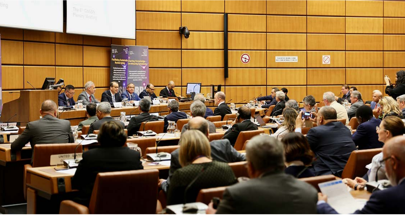
المشاركون في الاجتماع العام السادس للشبكة العالمية المعنية بالأمان والأمن النوويين في فيينا في أيلول/سبتمبر ٢٠١٩.

وبشكل عام، يجب أن يشارك المستخدمون المسجلون في نشاط أو أكثر من أنشطة الشبكة أو يمثلوا بلادهم أو منظماتهم بشكل مهني في مجال الأمان النووي أو الأمن النووي.