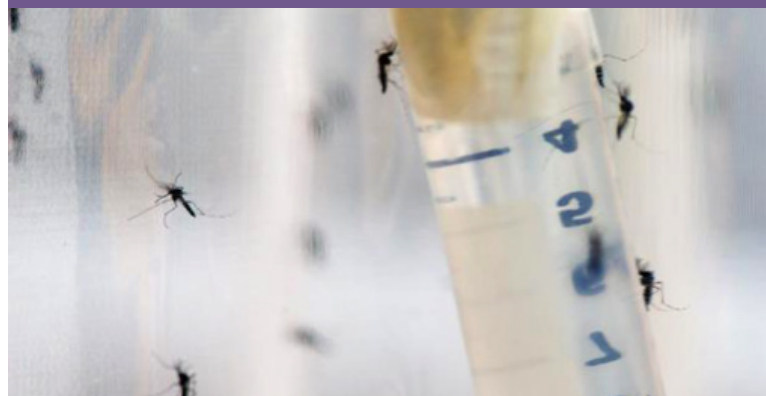
Los mosquitos Aedes pueden transmitir los virus que causan el dengue, el chikungunya y el zika.

Los últimos avances permiten albergar esperanzas sobre la eficacia de la cría en masa y la irradiación para la suelta de mosquitos macho estériles.