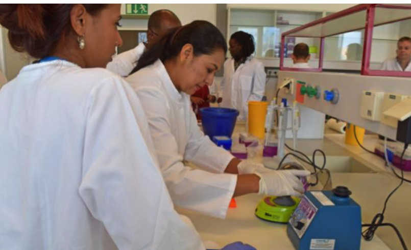
Varios participantes reciben capacitación en los laboratorios del OIEA de Seibersdorf para detectar el virus del Zika.

del OIEA para desarrollar y validar la TIE a fin de reducir las poblaciones de mosquitos portadores de enfermedades.