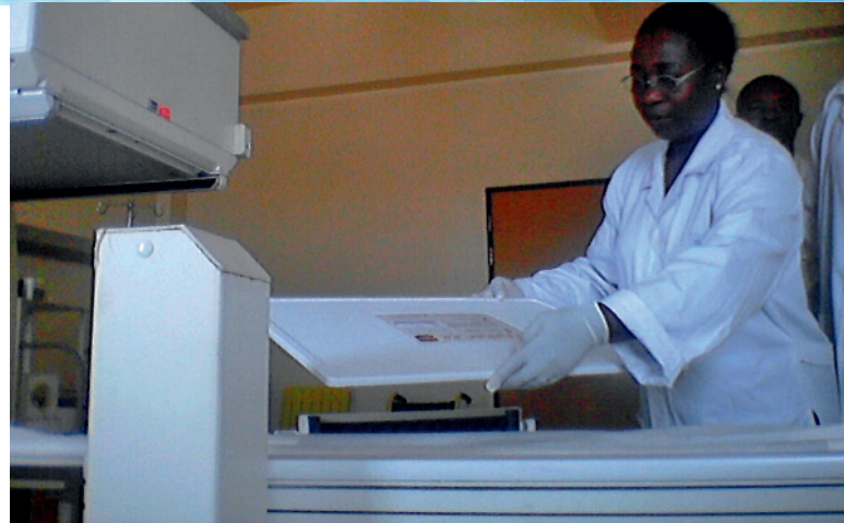
Una física médica mide la uniformidad de las imágenes de una cámara gamma como parte del proceso de garantía de calidad.

Los físicos médicos son profesionales sanitarios que han recibido formación académica y capacitación clínica especializadas en los conceptos y técnicas de aplicación de la física a la medicina. Por consiguiente, son competentes para garantizar que las tecnologías de la radiación que se utilizan para realizar pruebas de imagenología o tratar a los pacientes son seguras y