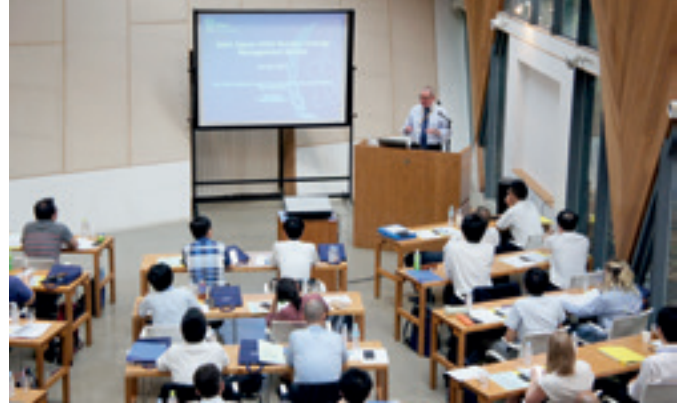
Charla sobre derecho nuclear en el Curso de Gestión de la Energía Nuclear celebrado conjuntamente por el Japón y el OIEA. Tokio (Japón), julio de 2017.

(Fotografía: Curso de Gestión de la Energía Nuclear celebrado en el Japón)