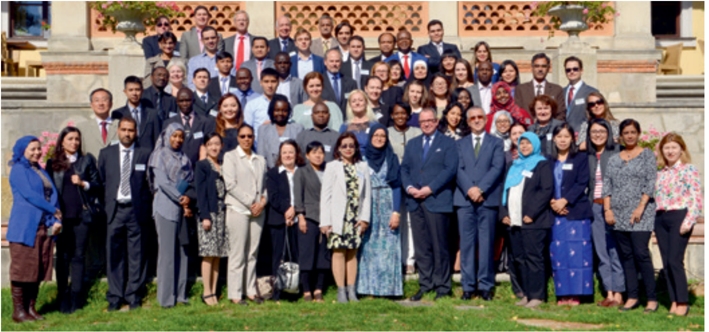
Reunión anual del Instituto de Derecho Nuclear del OIEA, celebrada en Baden (Austria) en 2015.

Importancia de contar con un marco jurídico nacional adecuado para utilizar la tecnología nuclear con fines pacíficos y en condiciones de seguridad tecnológica y física