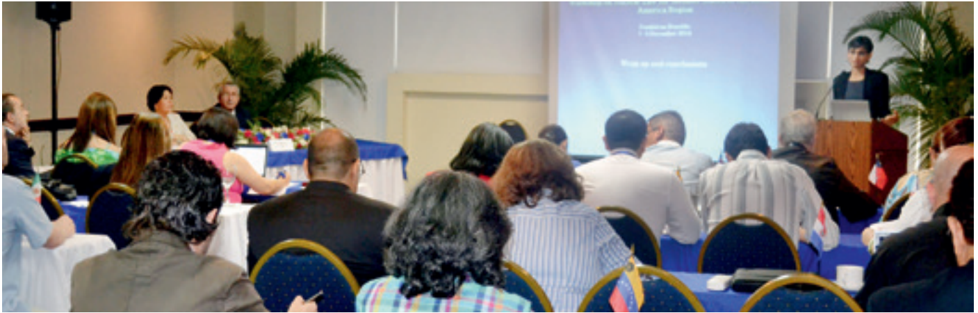
Participantes en el Taller sobre Derecho Nuclear para Estados Miembros de la Región de América Latina, celebrado en Santo Domingo (República Dominicana), en diciembre de 2014.